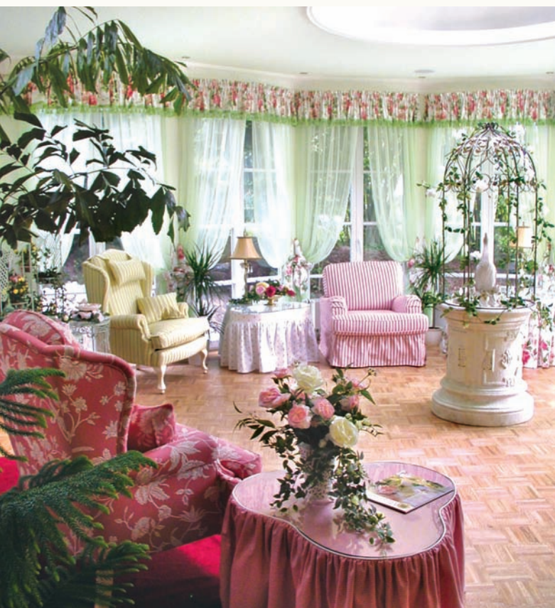
Rilassatevi nella veranda della HG Naturklinik Michelrieth